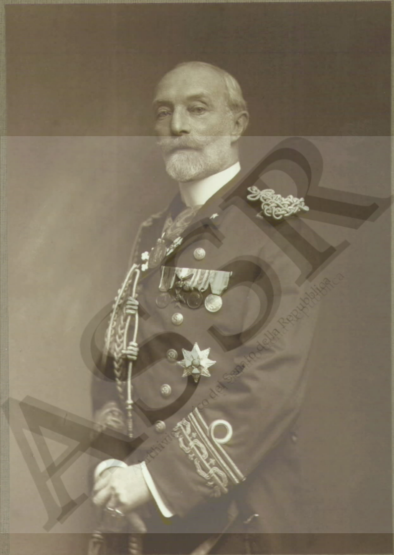
Ernesto Presbitero 1871 OMS